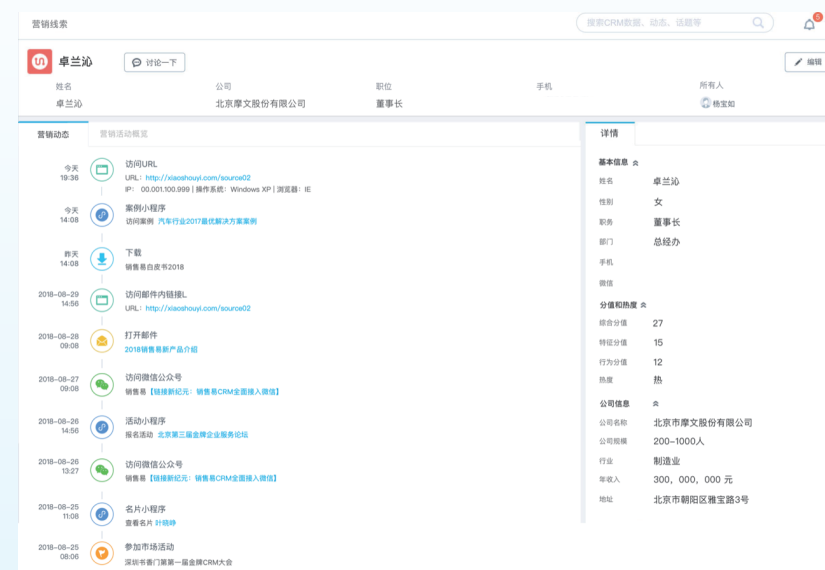
多渠道用户行为轨迹追踪