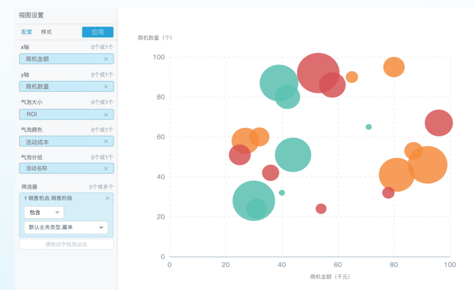
从线索到结单的端到端ROI分析